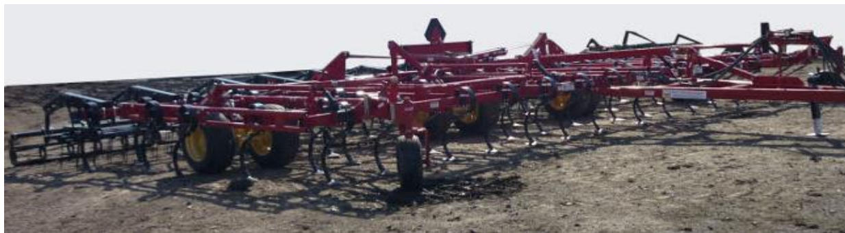
Рисунок 11 – Культиватор KRAUSE 5635-34

Культиватор KRAUSE 5635-34 фирмы «Krause» (США) полуприцепной, предназначен для сплошной обработки почвы, предпосевного рыхления и ухода за паром, содержит стрельчатые лапы, бороны и катки рисунок 11.