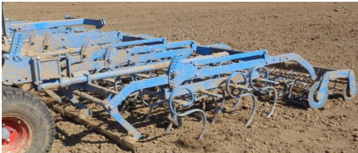
Рисунок 9 – Культиватор KORUND 8/750

держит оборотные лапы, выравнивающие плиты, катки. При этом выравнивающие плиты установлены впереди основных рабочих органов[11]. Ширина захвата 7,4 м, навесной способ агрегатирования. Низкая скорость (7 км/ч) приводит к снижению производительности культиваторного агрегата рисунок 9.