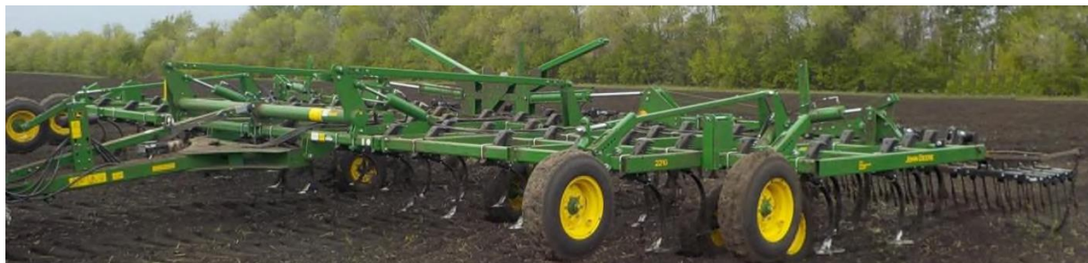
Рисунок 7 – Культиватор JOHN DEERE 2210LL [92]

Культиватор JOHN DEERE 2210LL полуприцепной, к тракторам тягового класса 5, содержит пять рядов плоскорезных лап пружинные бороны. Способен осуществлять поверхностную обработку почвы, в том числе паровых полей на рисунке 7.