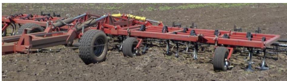
Рисунок 6 – Общий вид культиватора КПМ – 14

Семейство культиваторов КПМ (КПМ-8У, КПМ-10, КПМ-12, КПМ-14), произведённых в Республике Беларусь, предназначены для обработки паров на глубину 5-12 см. Полуприцепные, агрегируются с тракторами тягового класса 3 и 5. Ширина захвата 8, 10, 12, 14 м соответственно. Рабочая скорость до 12 км/ч. В качестве рабочих органов культиватора выступают четыре ряда стрелчатых лап и катки. Недостатком конструкции культиватора является превышение допусаемые габариты в транспортном положении [8]. В результате испытаний на МИС установлено, что транспортирование культиватора КПМ-14 производится только в соответствии с действующими правилами по перевозке негабаритных грузов рисунок 6.