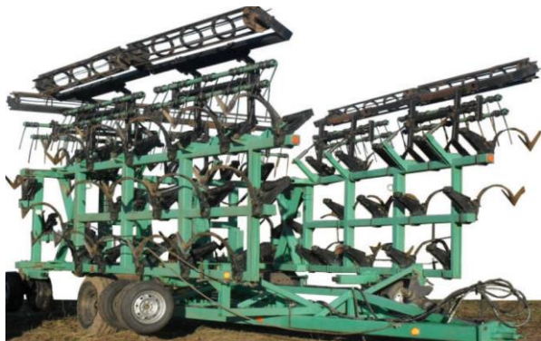
Рисунок 5 – Культиватор КПК-12

фективность его работы только на глубине 11-12 см, поэтому в вопросе уничтожения сорной растительности он довольно слаб, поскольку основная растительность находится на глубине 11-12 см [7].