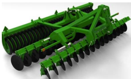
Рисунок 3 – Культиватор КДК-4

Недостатком машин данной обусловлено недостаточным показателем подрезания сорных растений при высокой засоренности поля, так как не имеет лаповых рабочих органов. Так же данный агрегат является неэффективным при работе в условиях появления эрозионных частиц, потому что дисковые рабочие органы создают довольно объемное распыление почвенных частиц [5].