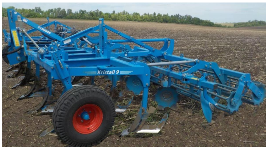
Рисунок 8 – Культиватор KRISTALL 9/600K

Заслуживает внимания оригинальная конструкция культиватора KRISTALL 9/600K фирмы «Lemken» (Германия), агрегируемого тракторами тягового класса 5 [10]. Рабочие органы представлены в виде двух рядов лап оригинальной конструкции, ряда дисков (сферических) и катков, размещённых сзади дисков представлен на рисунке 8.