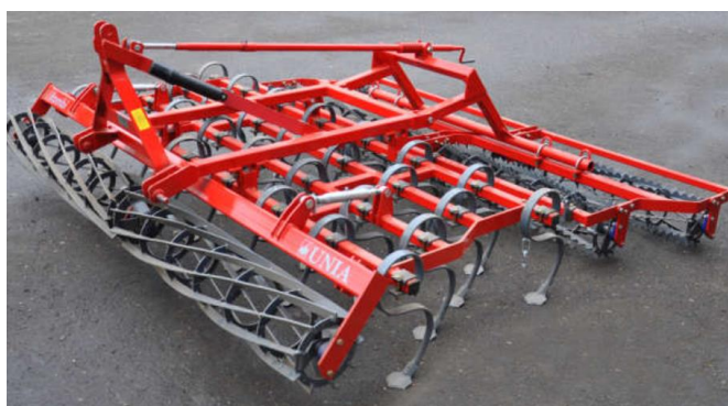
Рисунок 4 – Культиватор Комби 3 [55]

Заслуживает внимания культиватор Комби 3, содержащий лаповые рабочие органы в качестве основных и катки (струнный и зубчатый) как дополнительные рабочие органы [6]. В отличие от предыдущих культиваторов, в конструкции Комби 3 предусмотрен навесной способ агрегатирования с тракторами тягового класса 1,4. Функционирует с рабочей скоростью до 10 км/ч на глубину 4-9 см общий вид представлен рисунок 4.