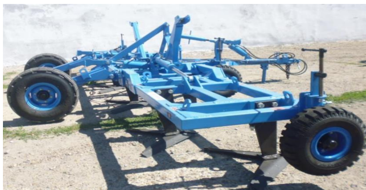
Рисунок 2 – Культиватор КППШ-9

Культиватор КППШ-9 изображенный на рисунке 2 содержит плоскорезные рабочие органы, функционирующие на глубину 7-18 см. Прицепной к тракторам тягового класса 5. Ширина захвата 9 м, рабочая скорость до 8 км/ч