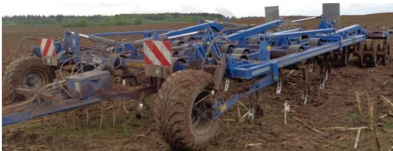
Рисунок 10 – Культиватор VARIO 400

Культиватор VARIO 400 фирмы «Kockerling GmH CO KG» (Германия) прицепной, содержит лаповые рабочие органы, бороны и катки рисунок 10.